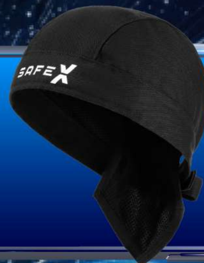
БАНДАНА SAFE X