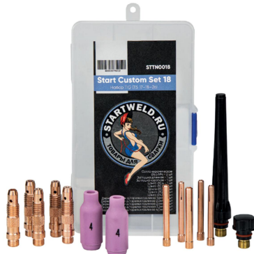
НАБОР TIG (TS 17-18-26) Start Custom Set 18 Артикул: STTN0018