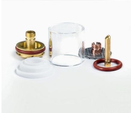
Start Custom set 7 (под вольфрамовый электрод Ø2.4)