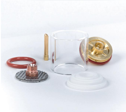
Start Custom Set 2 (9/20 TIG L GAS LENS 2.4MM 2P18GS1D2 35*32.5L)