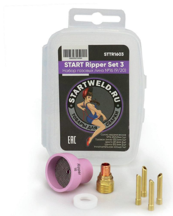
Набор газовых линз START Ripper Set 3 №16 (9/20) STTR1603