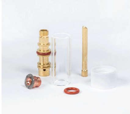
Start Custom set 5 (под вольфрамовый электрод Ø2.4)