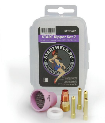
Набор газовых линз START Ripper Set 7 №16 (17/18/26) STTR1607